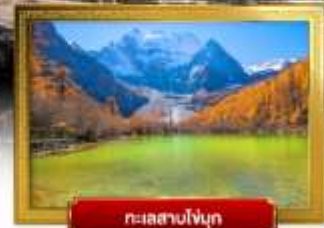
ทะเลสาบโง่กู่