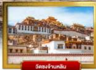
วัดชงจี้หลิน