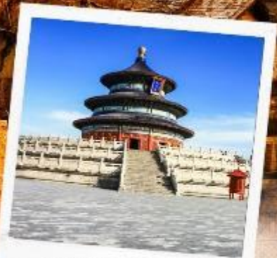
หอบูชาเทียนถาน