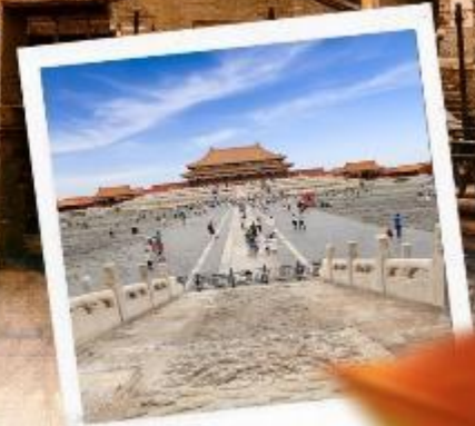
พระราชวังกู่กง