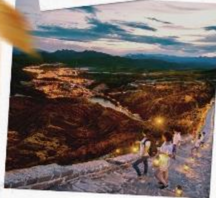
กำแพงเมืองจีนซื่อหม่าโถ