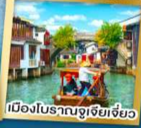
เมืองโบราณจู่เจียเจี้ยว