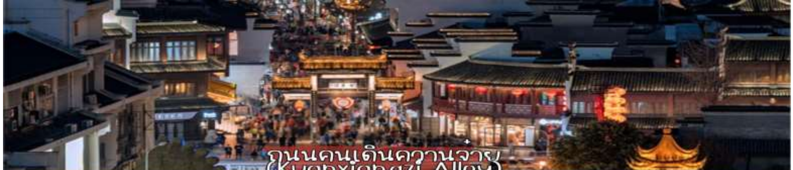
ถนนคนเดินความจำ (Kuanxiangzi Alley)

เช้า รับประทานอาหารเช้า ณ โรงแรมที่พัก นำท่านเดินทางจากก๊วยหยาง สู่สถานีรถไฟเฉิงตู เพื่อโดยสารรถไฟความเร็วสูงหัวจรวด G5392- : 09.07-12.38 น. (เวลาอาจมีการเปลี่ยนแปลงตามความเหมาะสม) เที่ยง รับประทานอาหารกลางวันบนรถไฟ แบบเข้าวกกล่อง หรือ บริการชุด KFC บ่าย นำท่านไปยัง ซอยความจำ แปลว่า "ซอยกว้าง-ซอยแคบ" ซอยความจำถือเป็นถนนอนุรักษที่มีสีสันที่สุดของเมืองเฉิงตู มีของให้เลือกชมทั้งของกิน เนื้อแพะย่างเสียบไม้ ไอศกรีม น้ำผลไม้ หมูสามชั้น รมควันชิ้นแบบแพค นำมาต้มผักรวมได้ต้องแบ่งใช้เนื่องด้วยจะมีรสชาติเค็ม น้ำพริกถั่วเขียว สำหรับนำมาผัดผัก ผลไม้ชิ้นชื่อต่างๆ ของมณฑลเสฉวน รวมถึงสินค้าของที่ระลึกต่างๆ ซึ่งมีทั้งหิน เครื่องประดับต่างๆ, หรือสิ่งของที่เป็นเอกลักษณ์โดดเด่นของประเทศจีน อาทิ น้ำเต้าที่ระลึก หรือ ภาพวาดจีน ผ้าพันคอ ตึกตาวงกุกุญแจหมีแพนด้า ตึกตาวหมีแพนด้า ฯลฯ