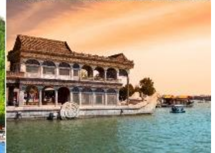
พระราชวังฤดูร้อนอ้าเหอหยวน