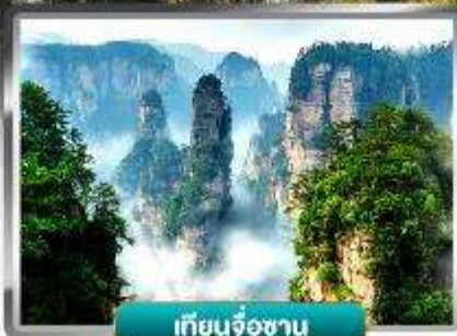
เทียนจื่อซาน