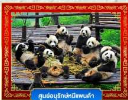
ศูนย์อนุรักษ์หมีแพนด้า