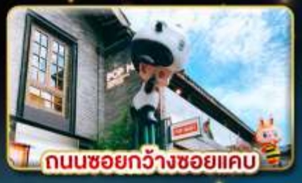
ถนนชอยกว้างชอยแคบ