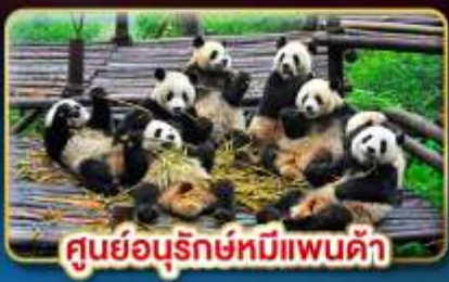
ศูนย์อนุรักษ์หมีแพนด้า

เที่ยว 3 อุทยานสวรรค์ "สัมผัสหิมะขาวโพลนแดนมังกร"