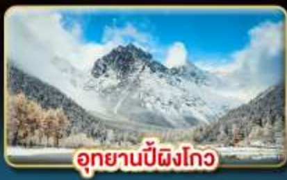
อุทยานปี้ผิงโกว