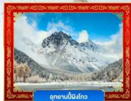
อุทยานปี้ฝิงโกว