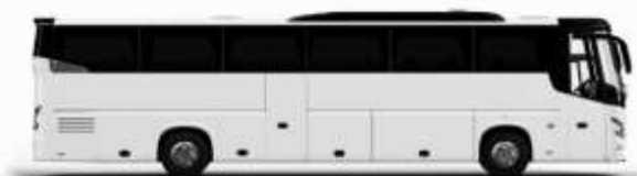
ตัวอย่างรถทัวร์ 1 ชั้น

ค่าที่พักตามที่ระบุในรายการหรือเทียบเท่าระดับเดียวกัน (พักห้องละ 2 ท่าน) หากประเภทห้องที่ท่านริเวสณาเกินจาก เช่น ริเวสคองพักเป็น TWIN BED หรือ DOUBLE BED ทางบริษัทขอสงวนสิทธิ์ในการปรับประเภทห้องพัก เป็นตามโรงแรมมีอยู่ โดยไม่ต้องแจ้งให้ทราบล่วงหน้า