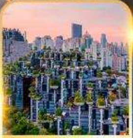
Tian An 1000 Trees