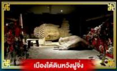
เมืองใต้ดินหวงฟูจิ่ง