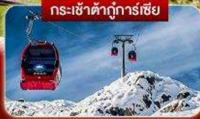
กระเช้าต้ากู่การ์เซีย