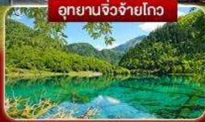
อุทยานจิ่งจ้ายโกว