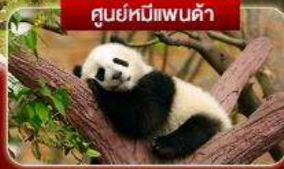
ศูนย์หมีแพนด้า

เดินทาง สัตว์ป่า หุบเขาชวงเฉียวโกว จิ่งจ้ายโกว เม่าเสี้ยน กระเช้าขึ้นภูเขาคิมะต้ากู่การ์เซีย รถไฟความเร็วสูงกลับเมือง แพนด้าซลฟี ไท่กู่ลี ศูนย์แพนด้า แพนด้าปิ่นตึก IFS ซูชิคู่ ซอยกว้างแคบ ชมแสงไฟลานห้าง SKP วัดต้าอ้อ