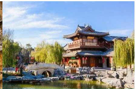
เมืองโบราณลั่วอี้