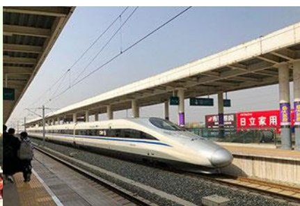
นิ่รถไฟความเร็วสูง