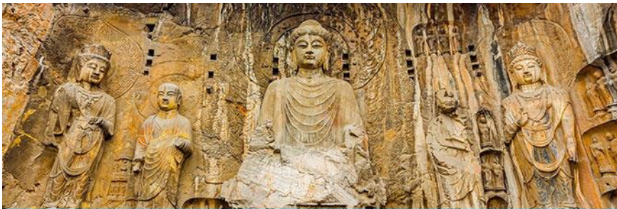
ถ้ำหินหลงเหมิน

พักที่ A TOUR HOTEL 4* หรือ โรงแรมในระดับเดียวกันในเมืองยูนเฉิง