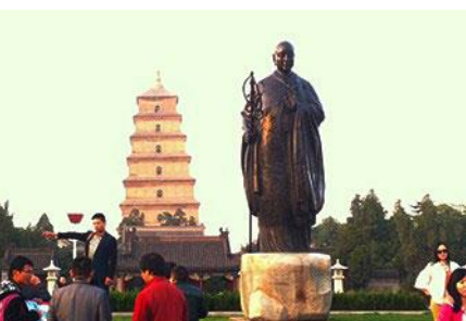
เจดีย์ห่านป่าใหญ่