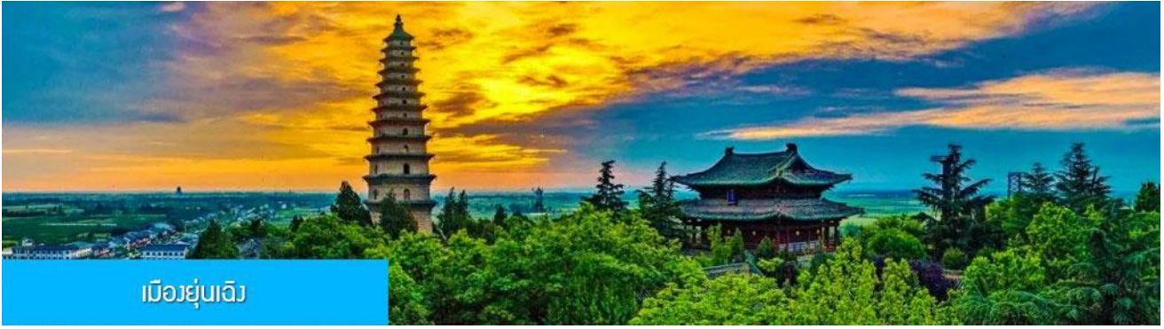
เมืองยูนเฉิง