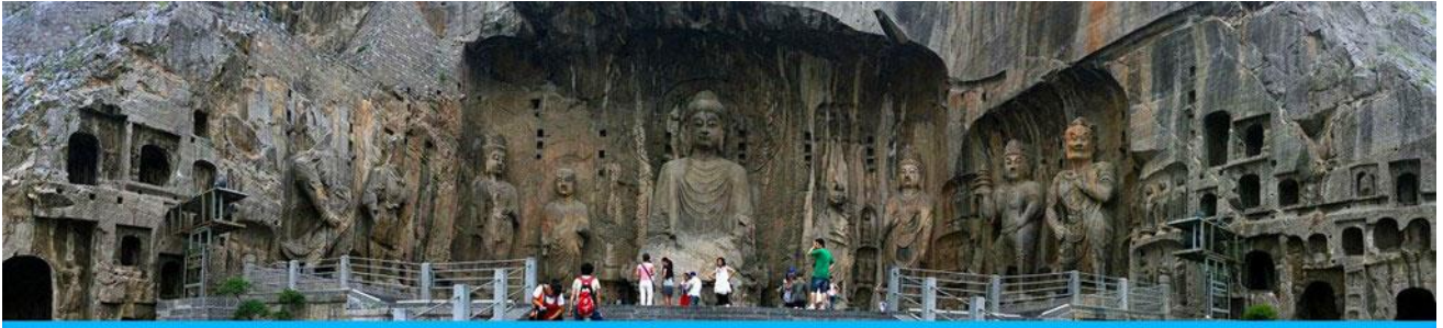
ถ้ำหินหลงเหมิน