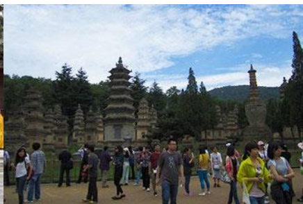
ป่าเจดีย์