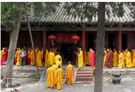
วัดเส้าหลิน

พักที่ โรงแรม REZEN HOTEL 4* หรือเทียบเท่าระดับเดียวกันเมืองลั่วหยาง