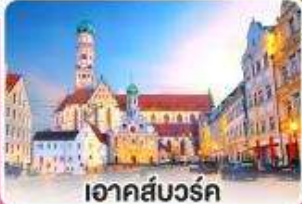
อาคส์บวร์ค