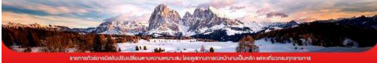
รายการทัวร์นี้อาจเปลี่ยนแปลงปรับเปลี่ยนตามความเหมาะสม โดยดูสถานการณ์หน้างานเป็นหลัก แต่จะเกี่ยวข้องกับรายการอาหาร