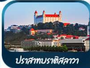
ปราสาทบราติสลาวา