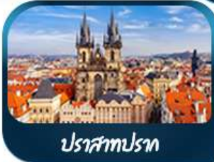
ปราสาทปราก

ชมความอลังการ ปราสาทนอยชวานสไตน์ เยือนเมืองมิวนิก จักรีสมาเรียนพลัทซ์ สัมผัสเมืองมรดกโลก เซนต์ ครุทลอฟ ถ่ายภาพไอโลท์! ปราสาทครุทลอฟ เยี่ยมชมปราสาทปราก ถนนทองคำ หอนาฬิกาคาราคัสคร์ เช็กจินสถานี่ชื่อดัง! ปราสาทบราติสลาวา สองเรือชมความงามแม่น้ำดานูบ แม่น้ำที่ยาวที่สุดในยุโรป ชมความน่าหลงใหลของ ปราสาทบูดาเปสต์ เที่ยวชมหมู่บ้านริทเก-เลซาบอัลสส์ดัทท์ พระราชวังเซ็นบรุนน์ สวนมิราเบล