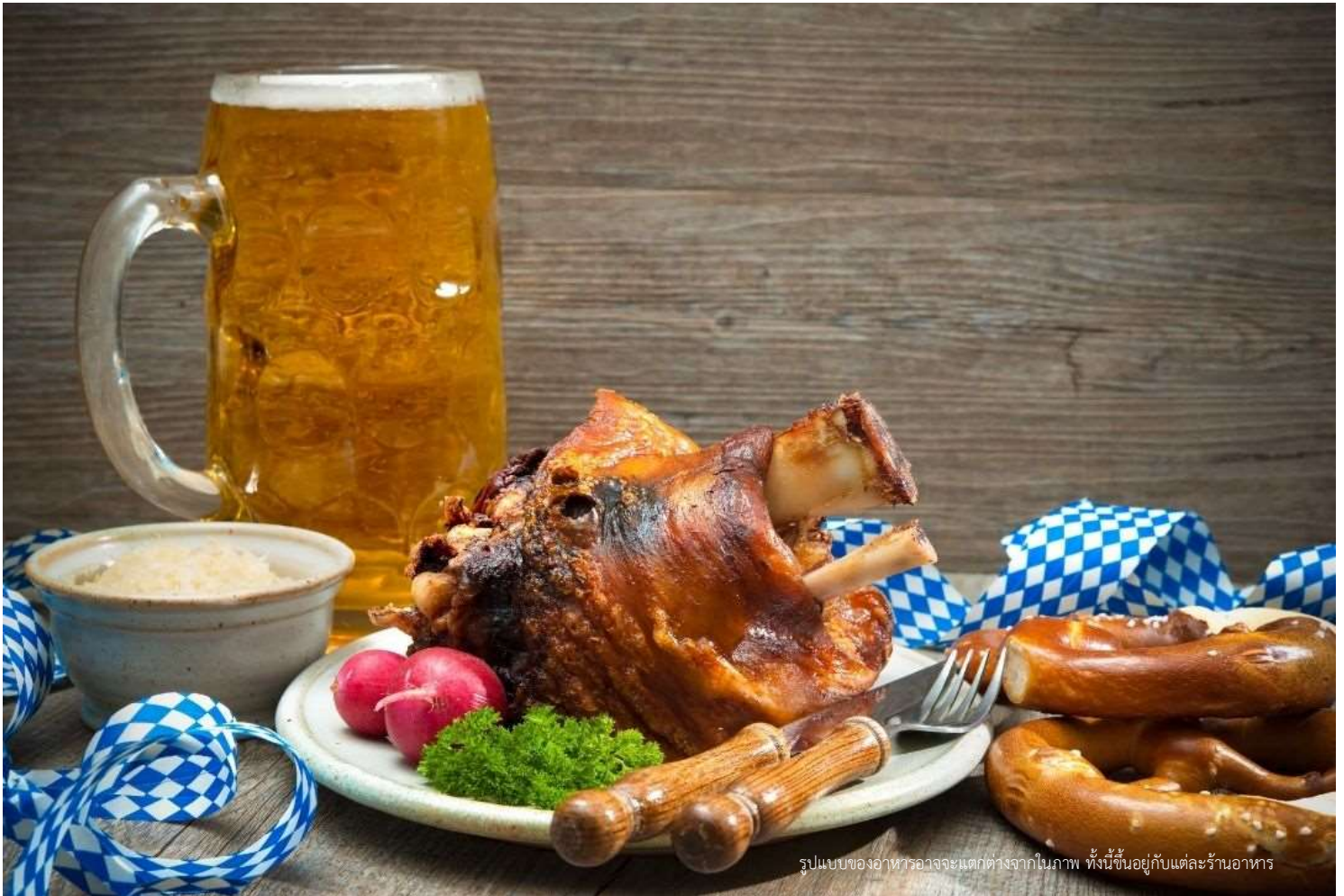
รูปแบบของอาหารอาจจะแตกต่างจากในภาพ ทั้งนี้ขึ้นอยู่กับแต่ละร้านอาหาร

วันที่สาม ฮัลล์สตัดท์-เมืองเซล์ก็ครุมลอฟ-ปราสาทครุมลอฟ