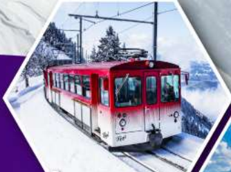
นั่งรถไฟใต้ดินสวิส