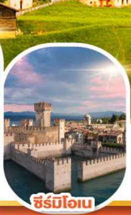
ซีร์มิโอเน

เดินทาง 04-10 มี.ค. 68 28 เม.ย. - 04 พ.ค. 68 30 พ.ค. - 05 มิ.ย. 68 11-17 มิ.ย. 68