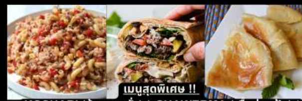
เมนูสุดพิเศษ !! KOSHARI (ข้าวคลุกถั่ว) / SHAWERMA (เนื้อห่อแป้ง) / FITEER BALADI (พิซซ่าอียิปต์)