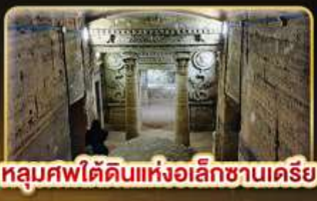
หลุมศพใต้ดินแห่งอเล็กซานเดรีย