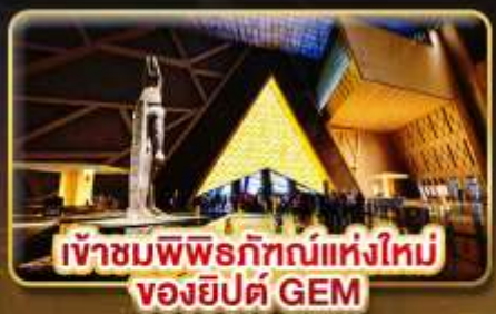
เข้าชมพิพิธภัณฑ์แห่งใหม่ ของยิปต์ GEM

ชม 1 ใน 7 สิ่งมหิศจรรย์ของโลก “มหาพีระมิดแห่งกิซ่า”