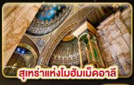
สุเหร่าแห่งโมฮัมเหม็ดอาลี

น้ำหนักกระเป๋า 23Kg. (ปีละหนึ่งกระเป๋า และปีละหนึ่งใบ)