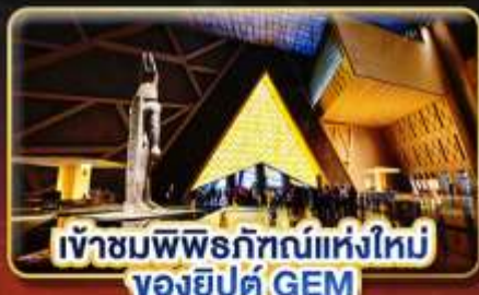
เข้าชมพีระมิดแห่งใหม่ ของอียิปต์ GEM