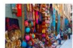
ตลาดข่านเอลคาลิลี

20.50 น. ออกเดินทางสู่อิสตันบูล เที่ยวบิน TK695