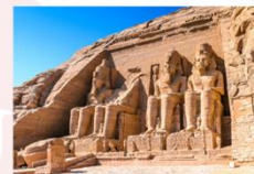
มหาวิหารอาบูซิมเบล

** พักที่ JAZ Crown Jewel Nile Cruise 4* หรือเทียบเท่า **