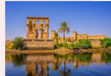
วิหารฟิเล

16.25 น. ออกเดินทางสู่กรุงโคโร สายการบิน Egypt Airlines เที่ยวบิน MS295