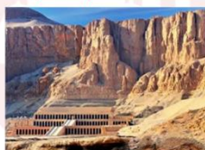
วิหารฮัคเซฟซุต

** พักที่ JAZ Crown Jewel Nile Cruise 4* หรือเทียบเท่า **