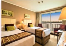
เรือสำราญแม่น้ำไนล์

** พักที่ JAZ Crown Jewel Nile Cruise 4* หรือเทียบเท่า **