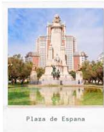
Plaza de Espana