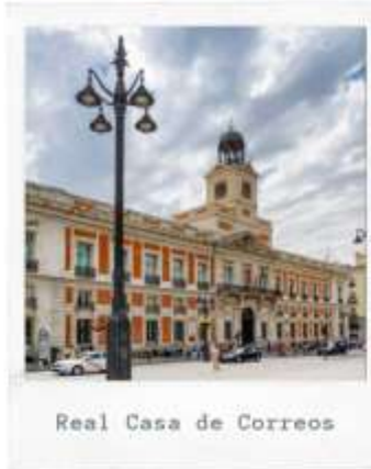
Real Casa de Correos