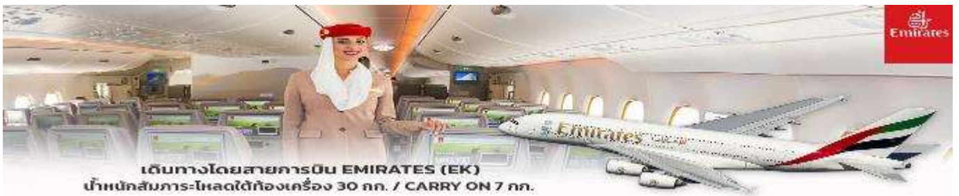
เดินทางโดยสารการบิน EMIRATES (EK) น้ำหนักสัมภาระ-โหลดใต้ท้องเครื่อง 30 กก. / CARRY ON 7 กก.

** การ์ตูน 15 ท่านออกเดินทาง พร้อมหัวหน้าทัวร์คนไทย **