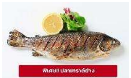
พิเศษ! ปลาเทราต์ย่าง

เกียง 🍴 รับประทานอาหารเกียง (มื้อที่6) เมบูพิเศษ ปลาเทราต์ย่างท่านละ 1 ตัว นำท่านเดินทางสู่ เมืองมรดกโลกเชสกี คุรมลอฟ (Cesky Krumlov) สาธารณรัฐเช็ก (ระยะทาง 210 กม./ 3.30 ชม.) ล้อมรอบด้วยแม่น้ำ Vltava ทำให้เมืองแห่งนี้มีลักษณะคล้ายหยดน้ำ จนถูกขนานนามว่าเป็น "เมืองหยดน้ำ" จากนั้นนำท่านถ่ายรูปบริเวณรอบนอก ปราสาทคุรมลอฟ (Cesky Krumlov Castle) เป็นปราสาทกอธิคดั้งเดิม ตั้งอยู่ริมฝั่ง