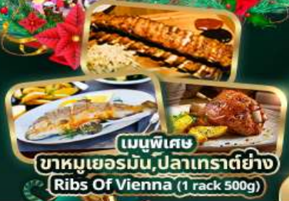
เมนูพิเศษ ขาหมูเยอรมัน, ปลาเทราต์ย่าง Ribs Of Vienna (1 rack 500g)

บริการนำดื่มวันละ 1 ขวด ฟรี! ปลั๊กไฟยูนิเวอร์แซล