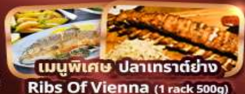
เมนูพิเศษ ปลาเทราต์ย่าง Ribs Of Vienna (1 rack 500g)

บริการนำดื่มวันละ 1 ขวด ฟรี! ปลั๊กไฟยูนิเวอร์แซล