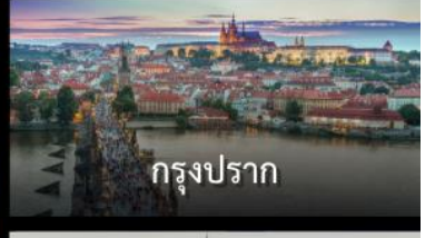
กรุงปราก