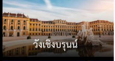
วังเซิงบรุนน์