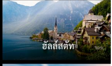
ฮัลล์สตัดท์