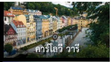
คาร์โลวี วารี