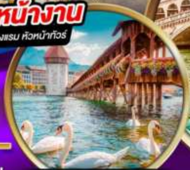
สะพานไม้ ซาเปลา