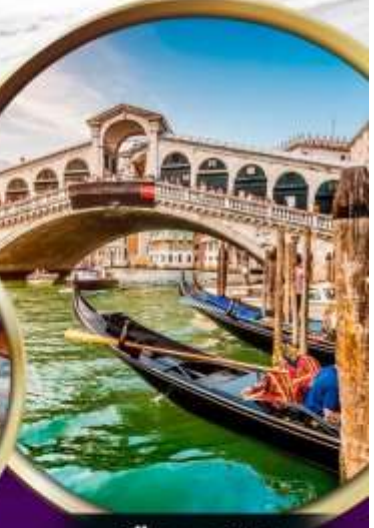
เมืองเวนิส