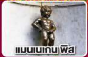
แมนเนเกน ฟิส