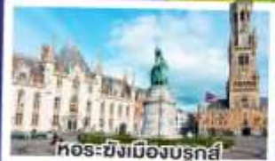
ทอร์ซิงเมืองบรูจส์