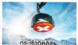
กระเช้าทิลิส