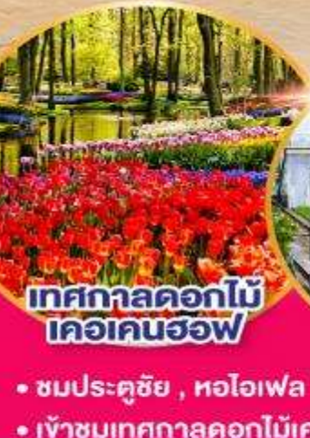
เทศกาลดอกไม้ เคอเคนฮอฟ