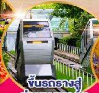
ขบวนรถไฟ ย่านมงมาร์ต