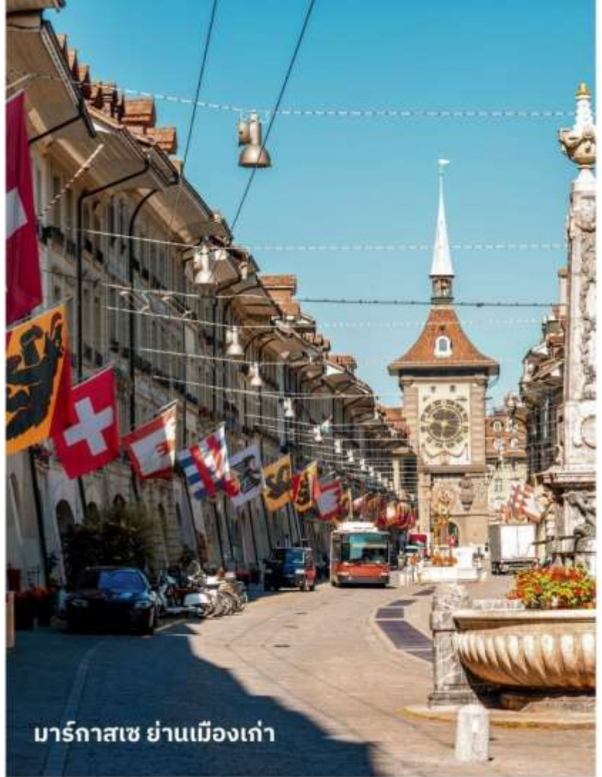
มาร์กาซเซ ย่านเมืองเก่า

ปัจจุบันเต็มไปด้วยร้านดอกไม้และบูติก เป็นย่านที่ปลอดภัยยิ่ง จึงเหมาะกับการ เดินเที่ยวชมอาคารเก่า อายุ 200-300 ปี