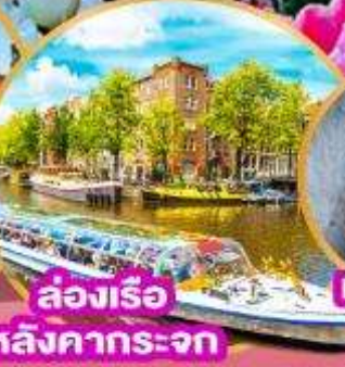
ล่องเรือ หลังคากระจุก