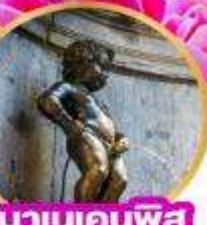
มานเคนพิส