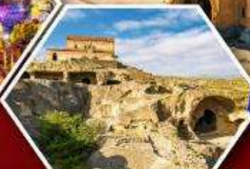
เมืองด้าอพลิสตึเคห์