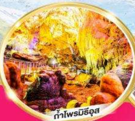
ถ้ำไฟรมิธอส