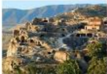
เมืองอุพลิสซิเค