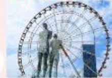
รูปปั้นอาลีและนีโน