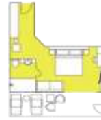
CATEGORY B Balcony Suite (6) app. 32 sqm, incl. Balcony