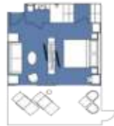
CATEGORY A Junior Suite (4) 40 sqm, incl. Balcony