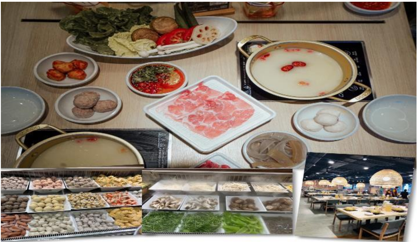
เที่ยง รับประทานอาหารเที่ยง ณ ภัตตาคาร (5) เมนูชาบู