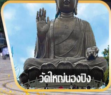
วัดใหญ่หนองปิง