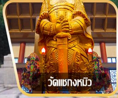
วัดชองกงหมิว