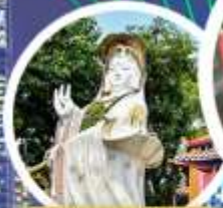
เจ้าแม่กวนอิม รัชส์ เบย์