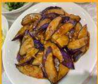
มะเขืออบหม้อดิน