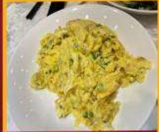
ไข่เจียวทรงเครื่อง