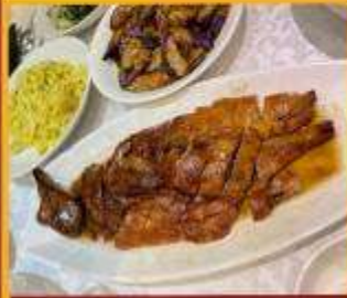
ท่านอย่าง