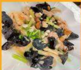
ไก่ผัดเห็ดหูหนู