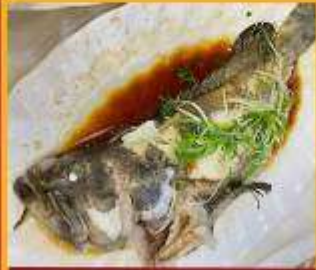
ปลาหนึ่งซีอิ้ว