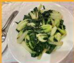
ผัดผักตามฤดูกาล