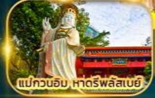
แม่ทวนอิม หารัฟลัสเบย์