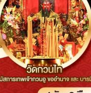
วัดกวนไท

นมัสการองค์เจ้าแม่กวนอิม อายุกว่า 600 ปี