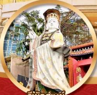
ริพัลส์เบย์