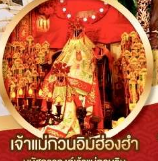
เจ้าแม่กวนอิมสี่องค์

นมัสการองค์เจ้าแม่กวนอิม อายุกว่า 600 ปี