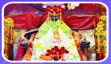
วัดเจ้าแม่กวนอิมสองขำ