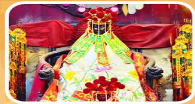
วัดเจ้าแม่กวนอิมสองอ่า