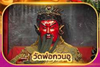
วัดพ่อกวนอู