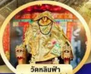
วัดหลินฟ้า โชคลาภและความมั่งคั่ง