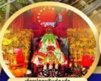
เจ้าแม่กวนอิมองค์อ่า นับถวายเป็นสิริมงคลกว่า 600 ปี