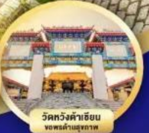
วัดหวังต้าเซียน ขอพรด้านสุขภาพ