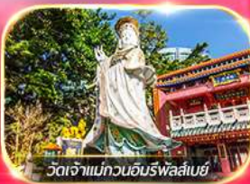
วัดเจ้าแม่กวนอิมพรอสโนะ