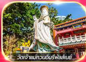
วัดเจ้าแม่ทวนอิมพรหลี่เบย์