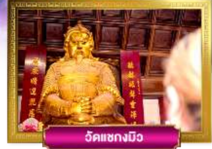
วัดแชกงมิ่ง