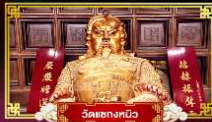
วัดเขมาภิรตาราม