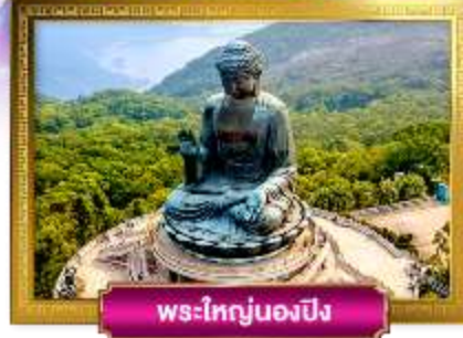
พระใหญ่นองปิง